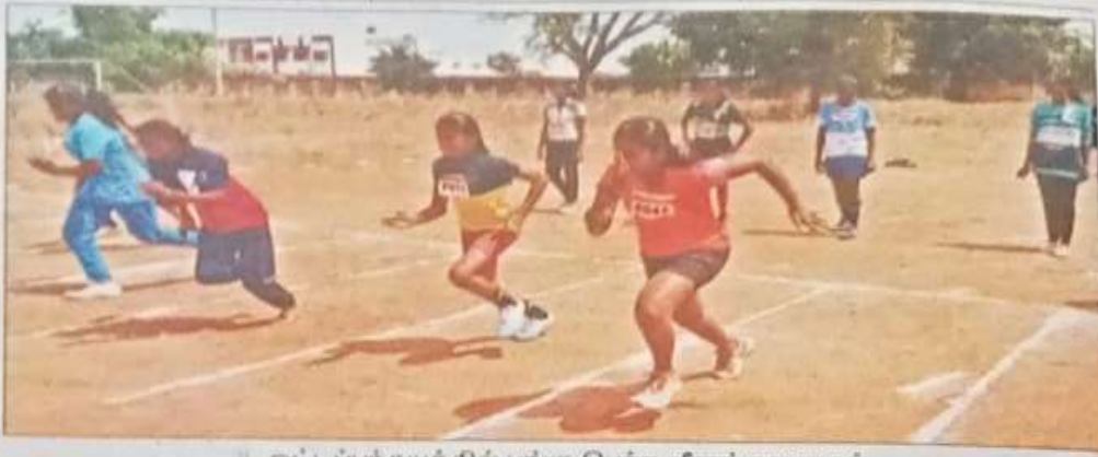
ஓட்டப்பந்தயத்தில் பங்கு பெற்ற வீராங்கனைகள், உடுமலை அரக கலைக் கல்லூரியில்